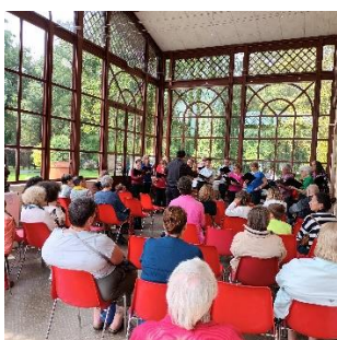
Entrée du musée de Sonneville : exposition, Le Cubisme à Bordeaux et dans la verrière chants interprétés par l'Ensemble Vocal Résonnance