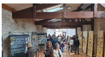
Expositions : l'Histoire des chemins et les crédentiales en Europe