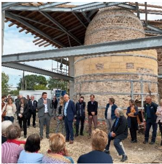
Four-bouteille externe rénové et cérémonie de présentation des travaux en présence d'une nombreuse assemblée

A l'honneur cette année trois sites principaux : la Poterie où a eu lieu la cérémonie de présentation des travaux de rénovation, le Château de l'Ermitage et le Prieuré de Cayac.