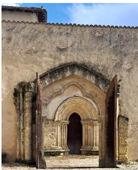
Vue partielle de l'ancienne église Notre-Dame de Cayac