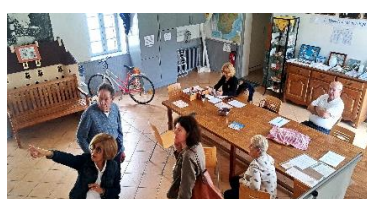
Visite guidée du gîte des pèlerins de Cayac