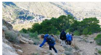
... 400 mètres de dénivellés en 4 kilomètres et des cailloux

Pour clôturer la journée nous faisons une descente vertigineuse et caillouteuse qui nous ramène aux voitures où nous dégustons le gouter préparé par Dominique avant d'entonner ULTREIA et de repartir les jambes un peu lourdes mais le cœur léger après ce magnifique week-end !