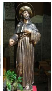
Statue de Saint-Jacques, église Saint-Jacques, Jaca