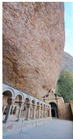
Surplomb rocheux au-dessus du cloître