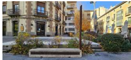
Hito 2, situé à côté d'un tracé archéologique qui correspondrait à un ancien site sacré datant de l'époque romaine.