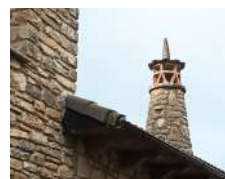
Capiscoles ou es-pantabrujas : faitage de la cheminée sensé protéger des mauvais sorts des sorcières