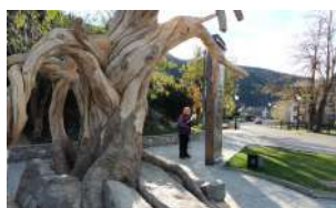
Arbre-symbole en hommage aux femmes guérisseuses, considérées comme sorcières qui furent torturées, brûlées aux XVe/XVIe S.