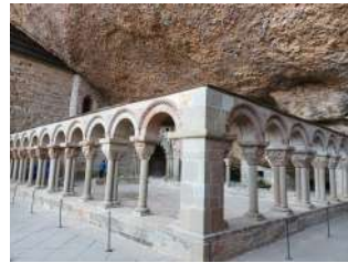
Cloître fin XIe-XIIe siècle