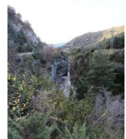
Gorges du rio Aragón