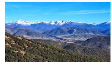
Chaîne pyrénéenne enneigée