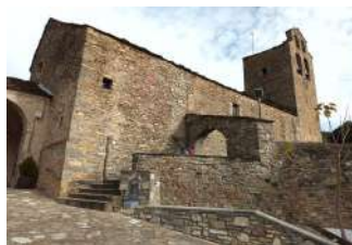
Eglise San Miguel Arcangel, Castiello de Jaca, village « Aux cent reliques ».