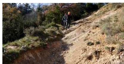
Descente rapide vers Santa Cruz de la Serós ...