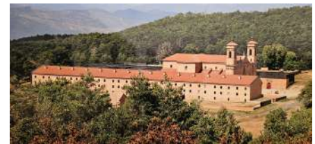
Monastère San Juan de la Peña nouveau, début de construction 1676