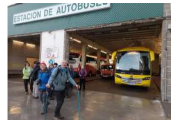
Gare routière de Jaca. Départ pour Canfranc.