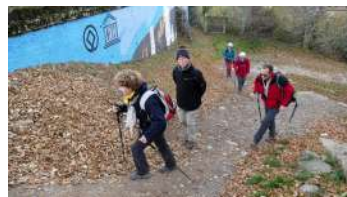
Dernière « rampette » avant d'arriver à Jaca