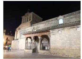
Cathédrale San Pedro, Jaca. Début de construction 1077