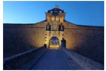
Entrée de la citadelle, Jaca. Début de construction 1592

Dans les rues nous croisons nos amis madrilènes et nous nous donnons rendez-vous pour le diner au restaurant ; décor rococo et service efficace nous y attendent.