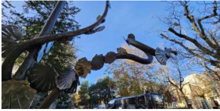
Coquilles grimpantes. Paseo de la constitución, Jaca