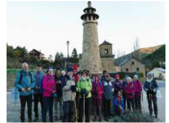
Pèlerins-marcheurs de Cayac et du Bouscat

L'endroit est d'une émouvante beauté et la visite passionnante. Nous trouvons facilement le HITO 4 juste en face de l'autre côté de la route. Une dernière petite grimpette nous amène au nouveau monastère datant lui du 17 siècle .