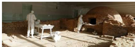
Musée archéologique relatant la vie des moines, à l'arrière plan : un four