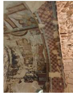
Peintures murales Crypte, début Xe s.