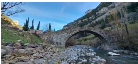
« Pon nou » (pont neuf) en dialecte Canfranqués de racine occitane il disparut au début du XIXe siècle.