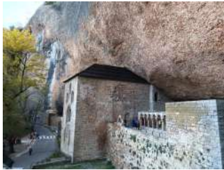
Monastère San Juan de la Peña. Début de construction Xe s.