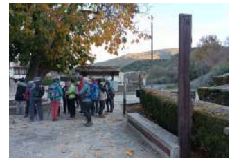
Hito 3 Santa Cruz de la Serós

Dimanche matin il fait - 3 degrés à Santa Cruz de la Serós quand nous reprenons le chemin depuis le HITO 3 au pied de l'église Santa Maria ; la montée est régulière et nous offre un panorama grandiose sur les sommets pyrénéens blanchis des premières neiges jusqu'à l'ancien monastère de San Juan De La Peña, trésor de l'époque médiévale niché sous une impressionnante paroi rocheuse.