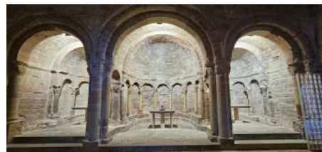
Eglise dédiée à Saint-Jean, XIe siècle