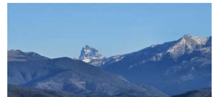
Pic du Midi d'Ossau 2884 m.