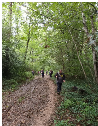
Un des passages boueux et glissants dans la forêt