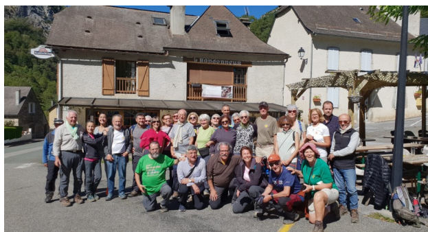
Photo souvenir, place d'Etsaut, devant le bar dimanche 24 septembre 2023

14h le bus des Espagnols repart vers Madrid après des « au revoir » sans fin... Alors que nous nous retrouverons dans un mois, fin octobre, pour la suite du Chemin et de belles aventures.