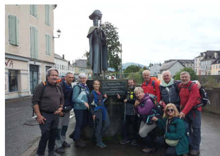
Quelques marcheurs prennent la pause devant le Pèlerin à Oloron Sainte-Marie