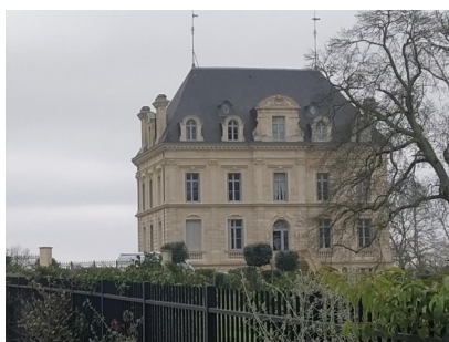
Château du Pian Construit en 1873

Nous n'avons pas eu le temps de voir défilé la journée que déjà nous nous voyons arriver au parking pour reprendre les voitures et recomposer les équipes de covoiturage.