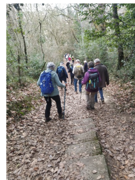
Chemin bucolique et parfois plus escarpé...