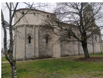
Eglise Saint-Siméon de Bouliac du XIIème siècle restaurée au XVème