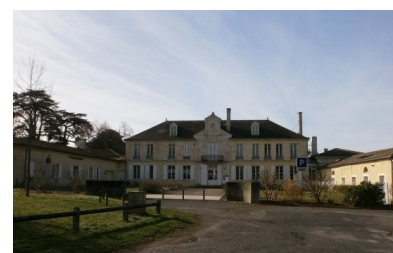
Château de la Burthe à Floirac du XVIIème siècle restauré au XIXème

Le groupe composé d'une trentaine de personnes tous attentifs à cette histoire a défilé dans les rues de Bouliac pour débiter la boucle de 11,5 Kilomètres prévue pour la matinée. Une variété de paysages se sont alternés : riches domaines et demeures, centre équestre, château et domaine de la Burthe à Floirac, chemins bucoliques, bois et tunnels végétaux. L'usage des bâtons fortement conseillé par l'équipe des organisateurs, nous a permis de franchir le dénivelé avec plus de légèreté.