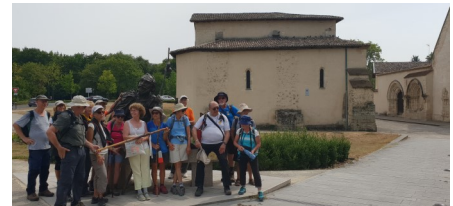
Arrivée du Bourdon Breton au Prieuré de Cayac. Les jacquets entourent le pèlerin de bronze réalisé par Danielle Bigata

Il était temps de rejoindre le Prieuré de Cayac en passant par le GR Métropolitain bordelais. Ce parcours, nous a permis de déjeuner à l'ombre des grands arbres du parc Mussonville à Bègles.