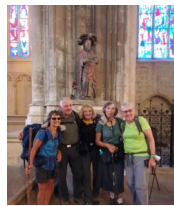
Réplique de la statue de Saint-Jacques : église Saint-Michel

Nous n'avons pas oublié la réplique de la statue de Saint-Jacques à l'intérieur de l'église Saint-Michel. (L'original datant du XVème siècle est exposée au musée d'Aquitaine de Bordeaux).