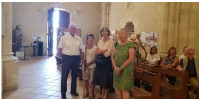
Intérieur de l'église Saint-Jacques du Barp

Quelques six kilomètres et nous sommes arrivés à l'hôpital-prieuré Notre-Dame de Cayac du XIIIème siècle. Au gîte des pèlerins, les hospitaliers nous attendaient. Nous avons eu très chaud, un peu d'eau et de sangria fraîches ont fait notre bonheur, en attendant de nous retrouver le lendemain au gîte du Barp pour un repas-partage.