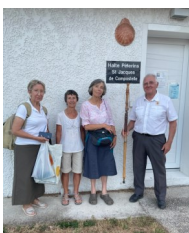
Le Bourdon Breton est arrivé au gîte du Barp département de Gironde

À la très belle église Saint-Jacques du Barp nous avons reçu la bénédiction des pèlerins. Nous nous sommes retrouvés tous au gîte pour les agapes.