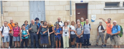
Les jacquets de Gironde et de Bretagne autour du Bourdon Breton devant le gîte de l'association du Bouscat

L'Association Bretonne des Amis de Saint-Jacques de Compostelle a contribué à l'année jubilaire en faisant voyager un bourdon sculpté entre Blain et Saint-Jacques de Compostelle. Ils étaient huit mini-bourçons partis de cinq départements bretons qui se sont regroupés à Blain pour rejoindre le chemin de Tours et former alors un seul Bourdon : le Bourdon Breton (BB). Après avoir traversé la Bretagne, la Vendée, la Charente-Maritime, il est arrivé en Gironde à Pleine-Selve le 11 Août. Plusieurs de nos amis de l'association du Bouscat ont accompagné les pèlerins porteurs du Bourdon Breton jusqu'à leur gîte.